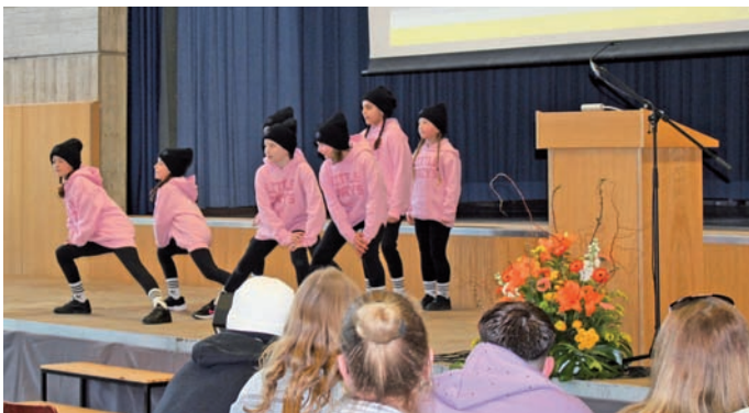
Tanzeinlage der „Little Crazy's“ der HipHop Tanzschule Waiblingen