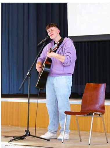
Auftritt des DSDS-Kandidaten Nando Mistl